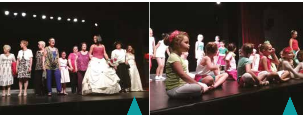
Défilé de l'atelier de couture

Succès garanti pour les galas de fin d'année du CALM